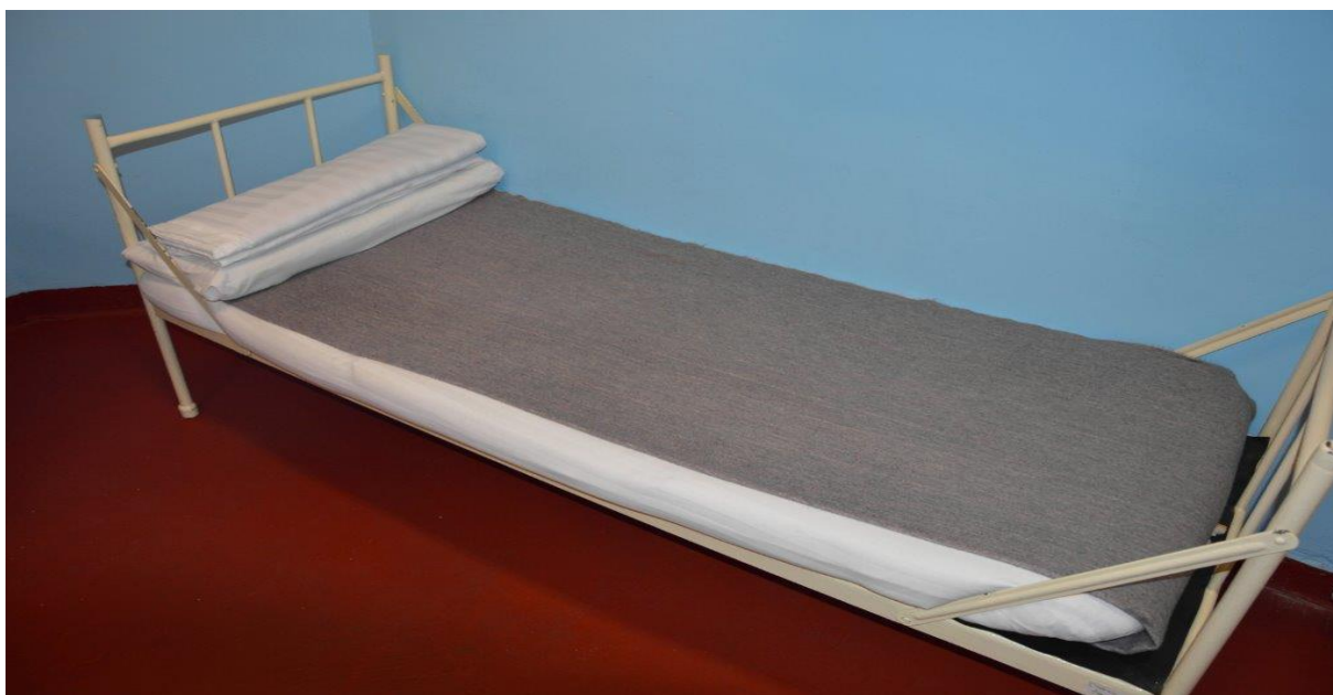
Obrázek č. 1 Vzor ustlaného lůžka